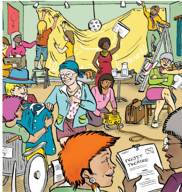
Illustration : Marie Dauverne