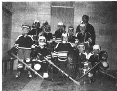
CLUB AIGLE NOIR