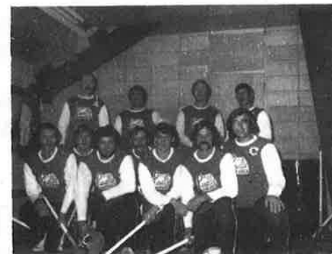
HOTEL LA SALLE, Weedon