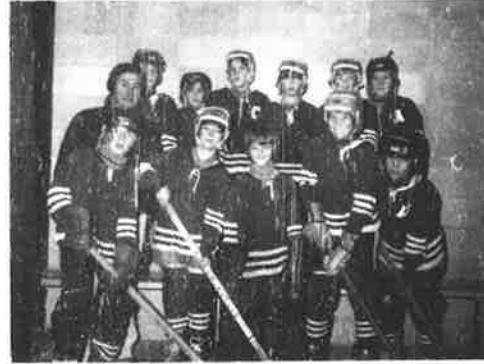
AU POULET DORE