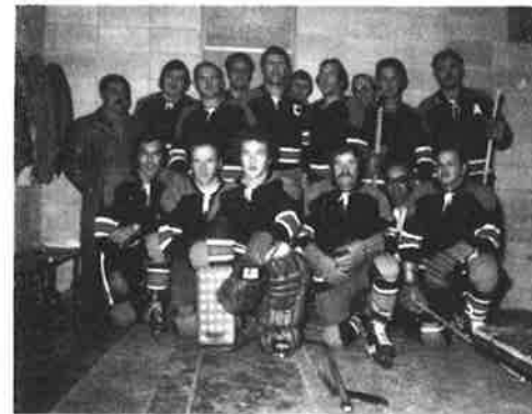
EAST ANGUS BRICK & TILE