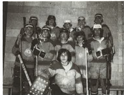
BROUSSEAU & FRERES