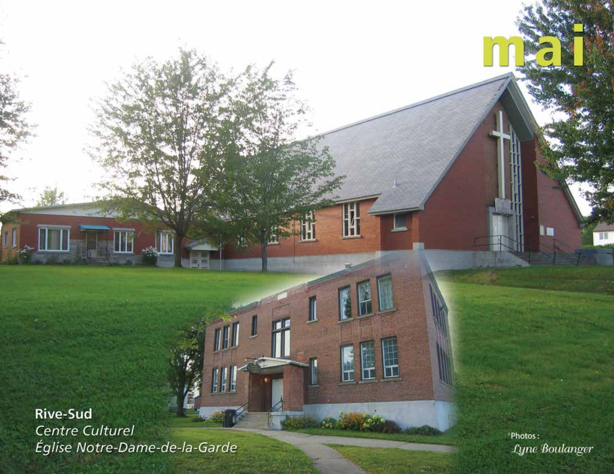
Rive-Sud Centre Culturel Église Notre-Dame-de-la-Garde