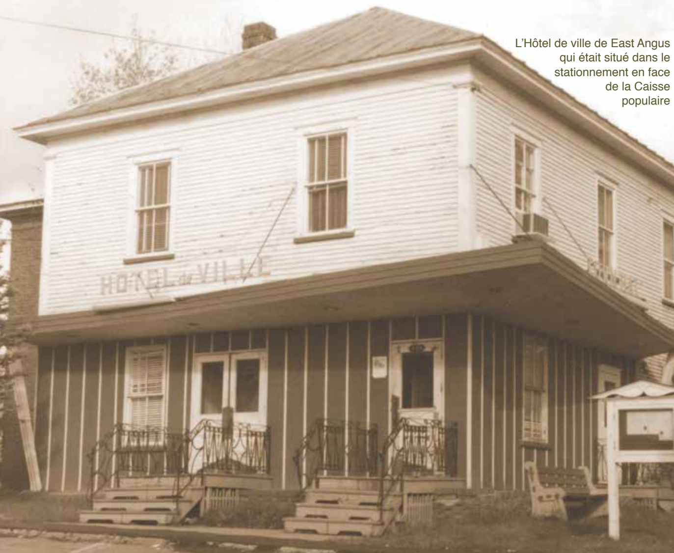
L'Hôtel de ville de East Angus qui était situé dans le stationnement en face de la Caisse populaire