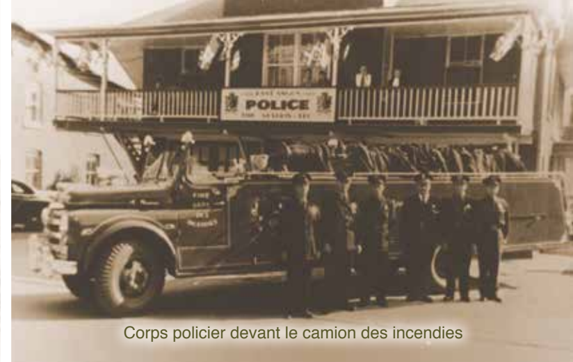
Corps policier devant le camion des incendies