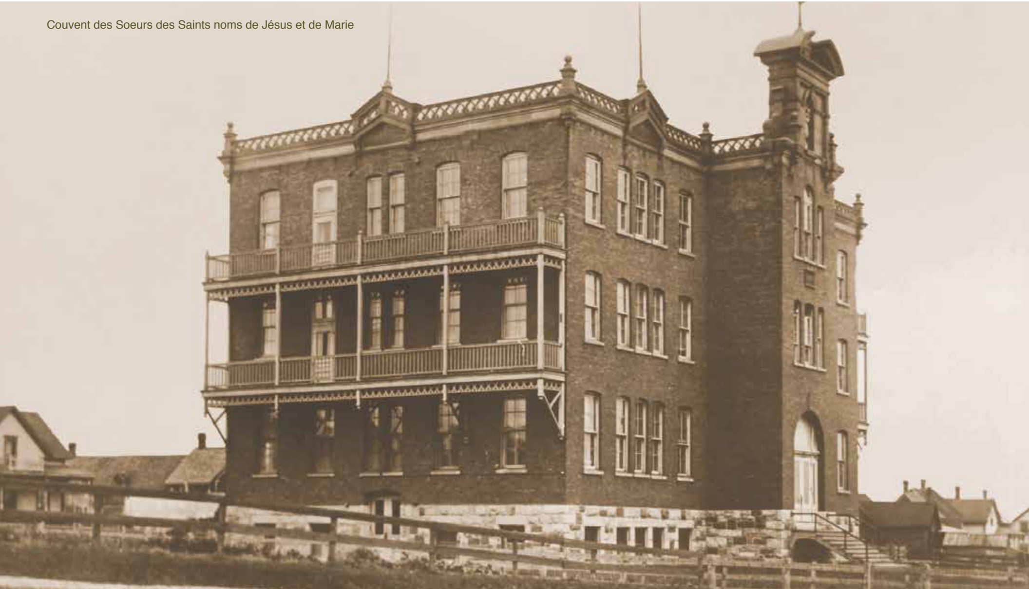
Couvent des Soeurs des Saints noms de Jésus et de Marie