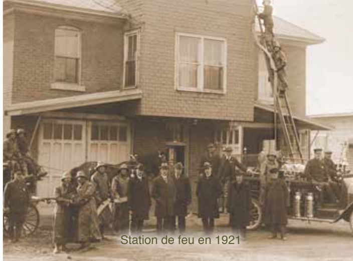
Station de feu en 1921