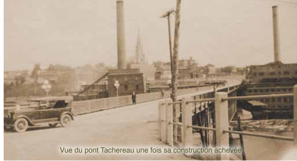
Vue du pont Tachereau une fois sa construction achevée