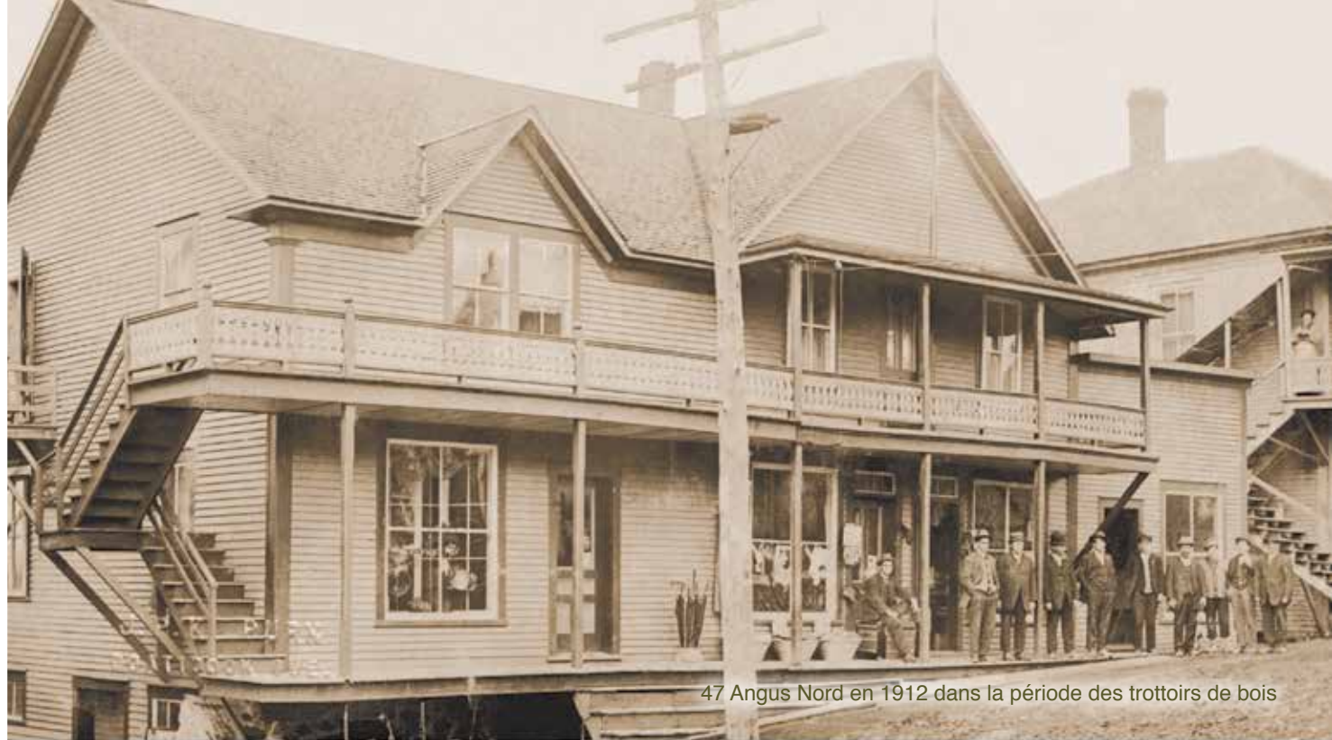
47 Angus Nord en 1912 dans la période des trottoirs de bois