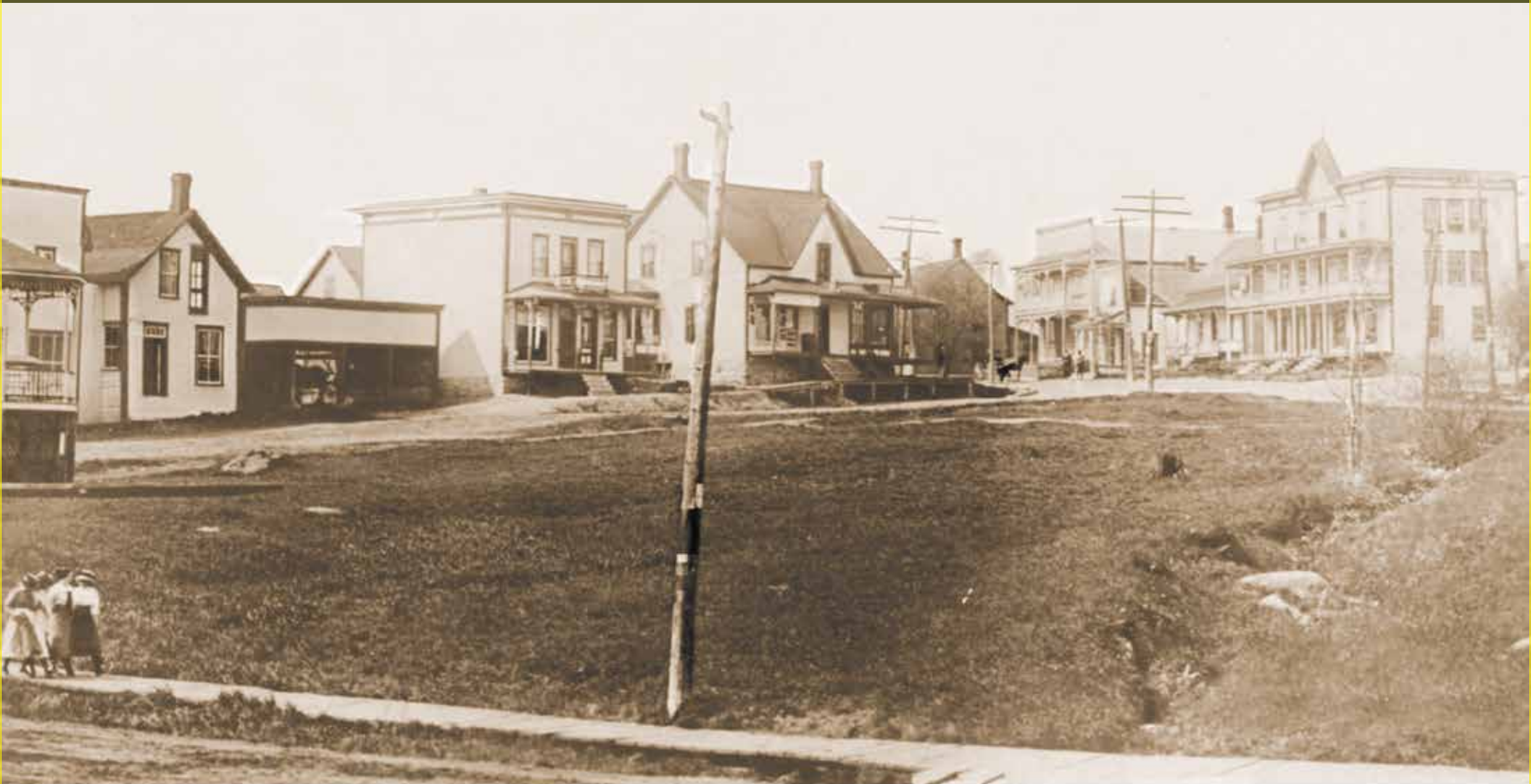
Victoria Square, l'emplacement du futur bureau de poste, à droite le ruisseau, en arrière l'hôtel commercial, à gauche le magasin Planche et le kiosque de l'harmonie de East Angus