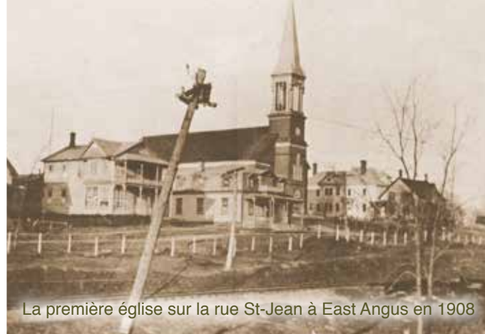
La première église sur la rue St-Jean à East Angus en 1908