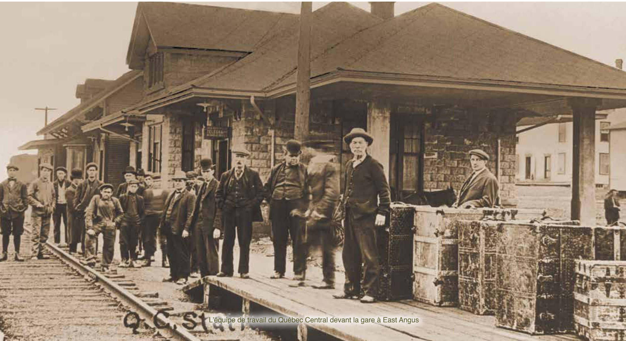
L'équipe de travail du Québec Central devant la gare à East Angus