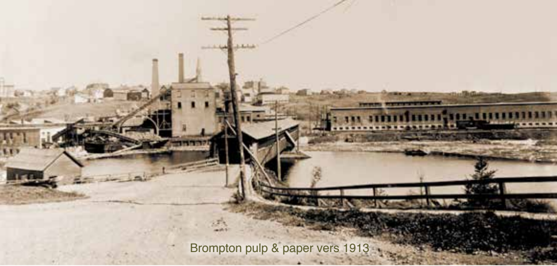
Brompton pulp & paper vers 1913